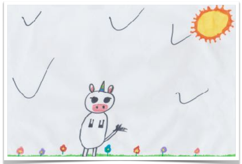
Eline BARCET (8 ANS)

Durant la période de confinement « Tous élus » a lancé un concours de dessins. Ils paraîtront dans les éditions à venir. Voici les 3 premiers.